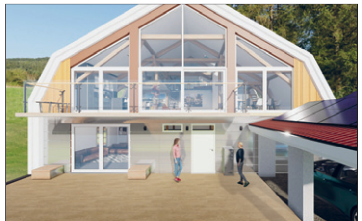
Blick auf das Mittelsächsische Haus