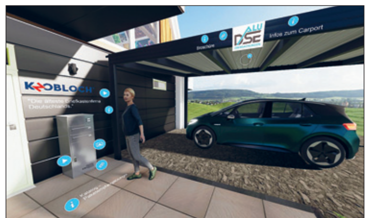
Blick auf einen Teil des Außenbereiches des Mittelsächsischen Hauses