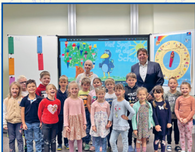
Grundschule Hartha Klasse 1a