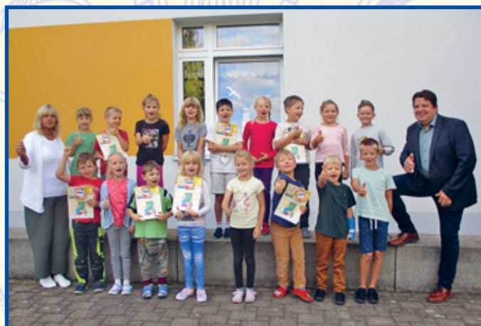
Grundschule Gersdorf Klasse 1 und 2