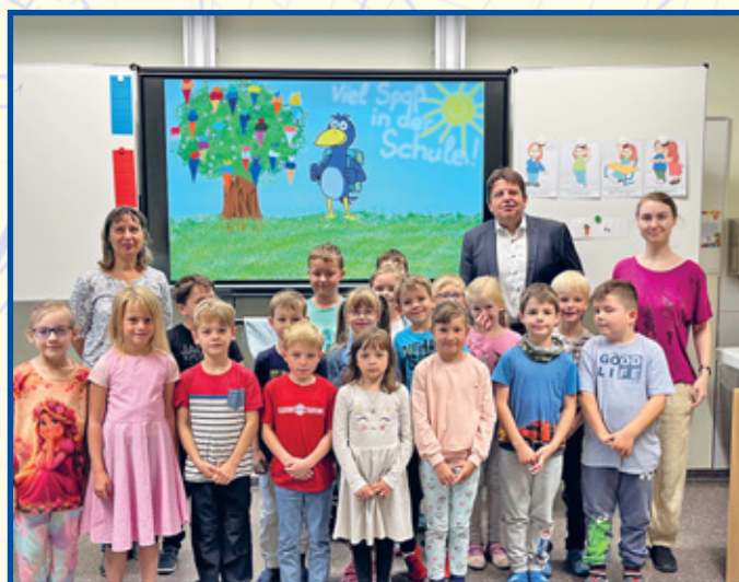
Grundschule Hartha Klasse 1b

„Jeder große Weg beginnt mit dem ersten Schritt.“