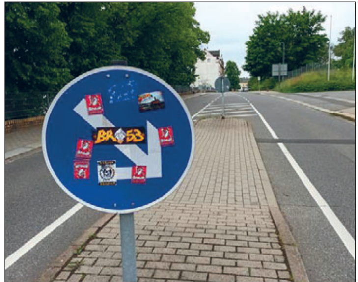
Leichtsinn mit teuren Folgen: Aufkleber auf Verkehrsschildern verursachen hohen Schaden.

Im Gemeindegebiet kommt es in letzter Zeit immer wieder zu einer bestimmten Form des Vandalismus: dem Bekleben von Verkehrszeichen und der Straßenbeleuchtung. Was manche vielleicht als harmlosen Streich einschätzen, ist tatsächlich nicht nur Sachbeschädigung, sondern auch ein gefährlicher Eingriff in den Straßenverkehr. Da Verkehrsschilder auch nachts gut erkennbar sein müssen, sind sie mit einer sogenannten Reflexfolie versehen. Werden nun Aufkleber auf dem Verkehrszeichen aufgebracht, so lassen sich diese meist nicht rückstandsfrei entfernen. Das hat zur Folge, dass das gesamte Schild ausgetauscht werden muss. Der Schaden kann schnell mehrere hundert bis tausend Euro betragen und wird bei der Polizei als Anzeige gegen Unbekannt registriert.