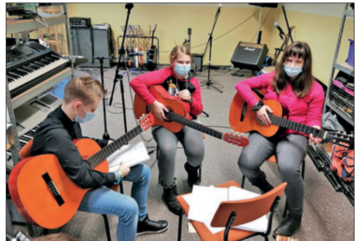
GTA FLA Gitarrengruppe