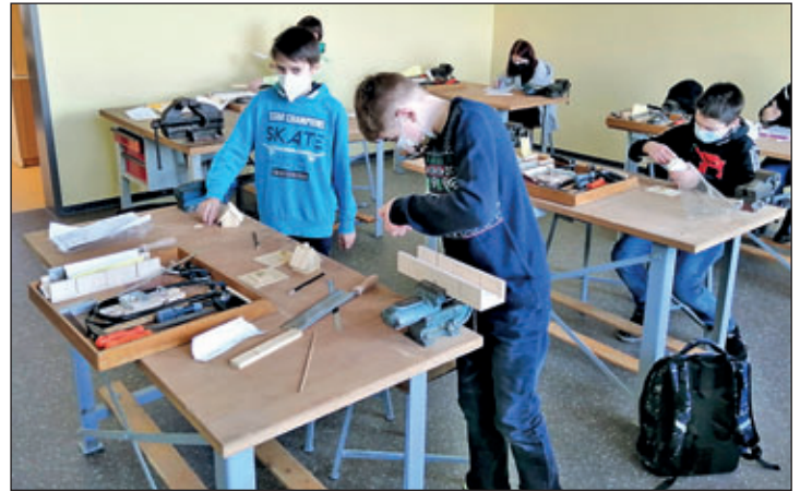
GTA FLA Arbeiten mit Holz