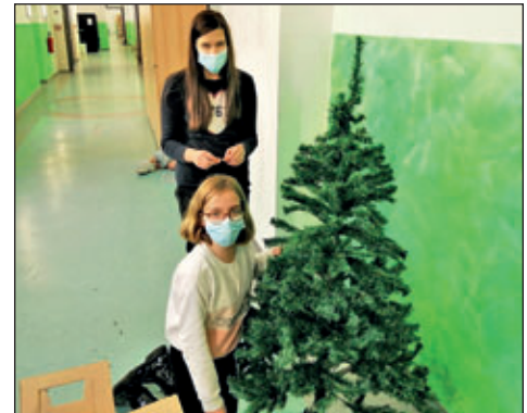
GTA AG Schulhausgestaltung