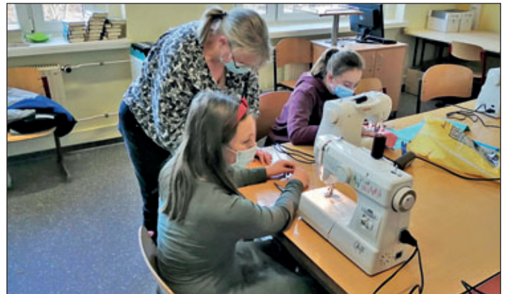
GTA AG Nähen