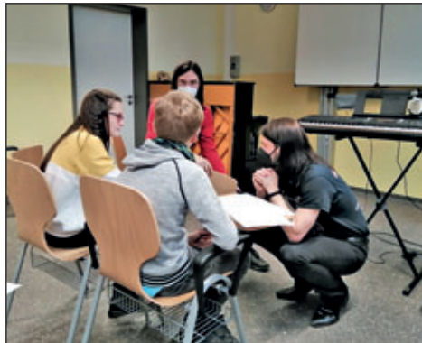
GTA AG Musik und Film