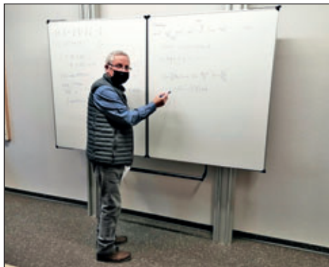
GTA FLA Mathe Fördern