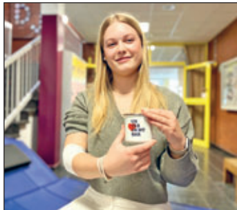
Junge Erstspenderin, die nach ihrer Blutspende die Information über ihre Blutgruppe erhält

Auch während der Sommer- und Ferienzeit können nur kontinuierliche Blutspenden die Patientenversorgung absichern