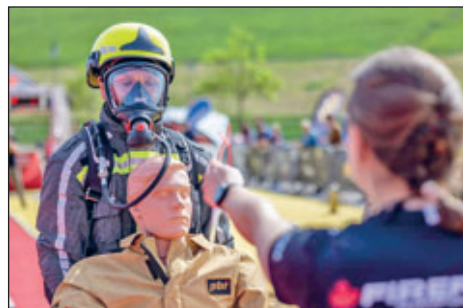
Feuerwehr Hartha (F.R.)