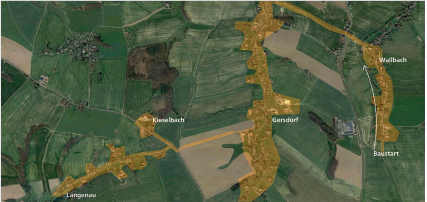
Bildquelle (Web + Phone): Bauübersichtskarte für den fünften Bauabschnitt

In den letzten Monaten ist der geförderte Breitbandausbau in der Stadt Hartha sehr gut vorangeschritten. Die Baumaßnahmen in Q4 wurden abgeschlossen und die ausbauende Firma hat bereits Ende August die Glasfaserarbeiten im fünften Abschnitt gestartet. Damit sind jetzt auch die umliegenden Dörfer von Hartha an der Reihe.