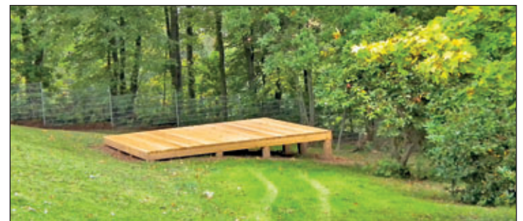
Plateau zum Lernen und Spielen