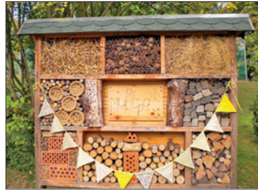
Kleinprojekt von 2020 – Errichtung eines Mußeparks in einer Grundschule – hier das Insektenhotel

Da in den letzten beiden Jahren die Lokale Aktionsgruppe SachsenKreuz+ e.V. gute Erfahrungen mit dem Regionalbudget gemacht hat, hat diese wieder Gelder aus dem Programm „Regionalbudgets im ländlichen Raum 2022“ zur Umsetzung des Rahmenplans