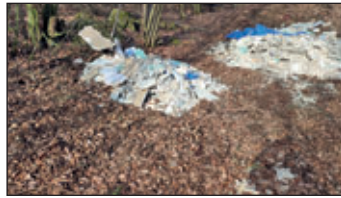
Unter den illegalen Müllablagerungen im Landkreis Mittelsachsen befinden sich häufig Baustellenabfälle.

In den vergangenen Monaten hat sich bedauerlicherweise ein sehr fraglicher „Trend“ fortgesetzt. Die Menge und Häufigkeit an wilden Müllablagerungen im Landkreis Mittelsachsen haben stark zugenommen. Illegale Müllplätze im Wald und Flur verschandeln nicht nur die Natur, sie können auch gefährlich für Mensch und Umwelt werden. Egal ob Hausmüll, Sperrmüll, Bauabfälle, sogar Lebensmittel, Tierkadaver oder Sonderabfälle – manche Bürger schrecken nicht davor zurück, alle Dinge des täglichen Lebens illegal zu entsorgen. Die „Entsorgung“ von Müll im Wald und Flur stellt dabei eine Ordnungswidrigkeit nach § 69 (2) Kreislaufwirtschaftsgesetz (KrWG) dar und kann mit einem Bußgeld von bis zu 100.000 Euro geahndet werden. Im Landkreis Mittelsachsen wird jede der EKM bekannte illegale Ablagerung der Landkreisverwaltung mitgeteilt und bei ausreichend Beweislast zur Anzeige gebracht. Erschreckend, dass viele der illegalen Ablagerungen aus Abfällen bestehen, die kostenfrei an den Wertstoffhöfen angenommen werden. Hierzu zählen etwa Elektroschrott, Sperrmüll (bis 3 m pro Anlieferung kostenfrei), Schrott, Papier oder Verpackungen. Schadstoffe können bis zu 30 Liter bzw. 30 Kilogramm beim Zwischenlager für Sonderabfall oder dem Schadstoffmobil ebenfalls kostenfrei abgegeben werden. Ungeachtet dessen können Bürger Sperrmüll, Leichtverpackungen sowie Papier und Pappe von zu Hause abholen lassen und sich somit sogar den Weg zu den Wertstoffhöfen ersparen.