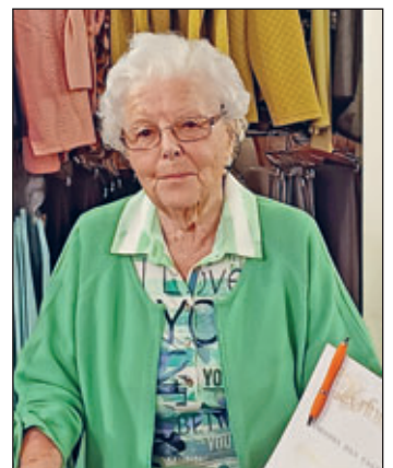
Jana Dost Seniorenpflegeheim Schönerstädt