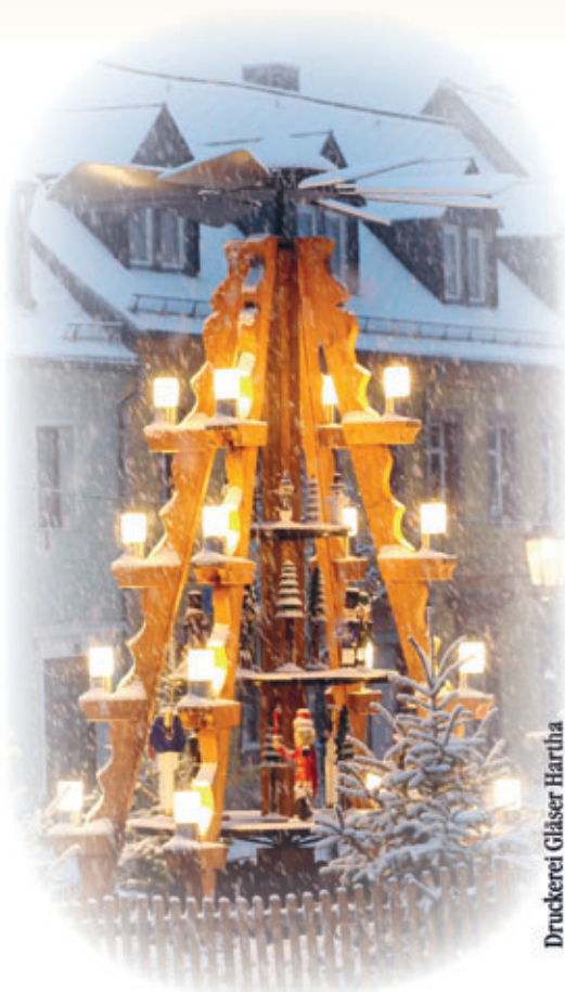
Druckerei Gläser Hartha

Änderungen und Ergänzungen vorbehalten! Stand: 07.11.2023