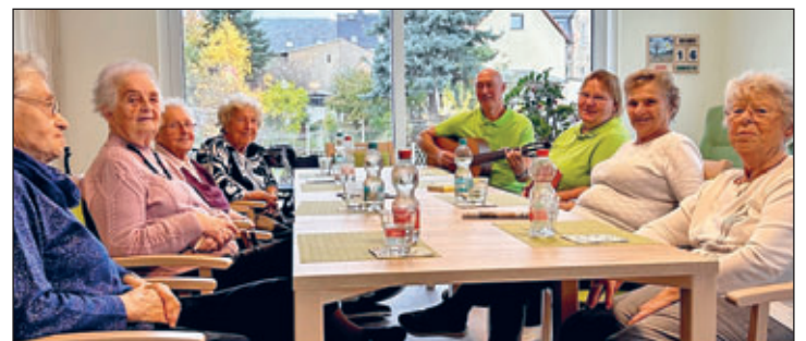
Gemütliches Beisammensein mit Musik und Reimen, passend zur Herbstzeit.