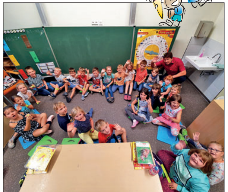
Pestalozzi Grundschule Hartha – Klasse 1b