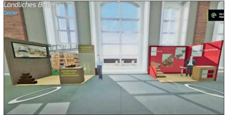
So wird die virtuelle Version vom ländlichen Bauen aussehen.