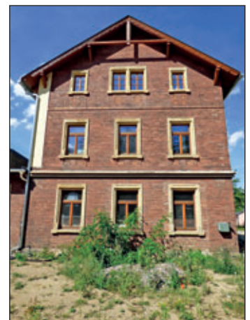
Halsbrücke, ehemaliger Bahnhof

den Messeständen können sich potenzielle Bauherren über natürliche Baustoffe, die Sanierung und Errichtung von Fachwerkhäusern und ländlichen Gebäuden informieren oder sich für die nachhaltige Nutzung des neuen Familiensitzes inspirieren lassen. Bauunternehmen, Handwerker und Experten für die Baufinanzierung stellen sich dort den Besuchern vor. „Wir freuen uns, dass Unternehmen auch in dieser besonderen Zeit rund um das ländliche Bauen informieren. Im teilsanierten Bahnhof in Halsbrücke sieht man eindrucksvoll, das zum Bauen auf dem Land neben einer Vision, dem Mut es anzugehen auch ein richtiger Plan und handwerkliches Geschick dazugehören“, sagt Dr. Lothar Beier in dessen Bereich als erster Beigeordneter in der Landkreisverwaltung auch