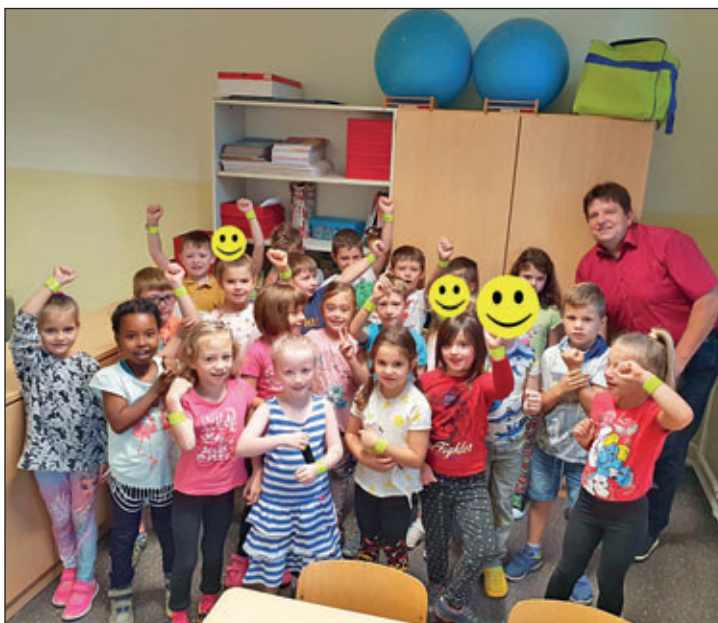
Pestalozzi Grundschule Hartha – Klasse 1a