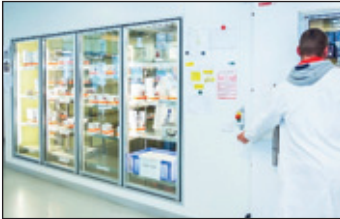
Blutdepot beim DRK-Blutspendedienst Nord-Ost

Etwa 15.000 Blutspenden werden deutschlandweit täglich benötigt, um den Blutbedarf von Kliniken decken und die Patientenversorgung lückenlos sicherstellen zu können. Allein rund 1.750 Blutspenden sind es, die jeden Tag in den fünf Bundesländern des gesamten Versorgungsgebietes des DRK-Blutspendedienst Nord-Ost für Patienten zur Verfügung stehen