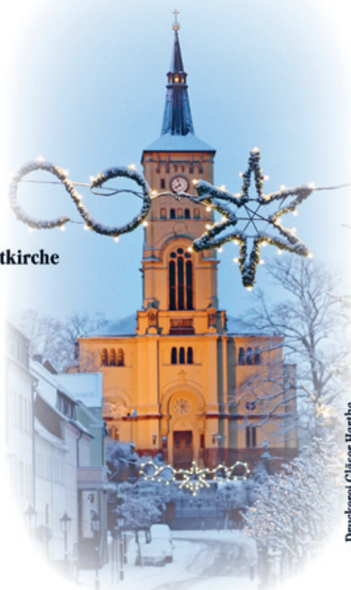
Druckerei Gläser Hartha