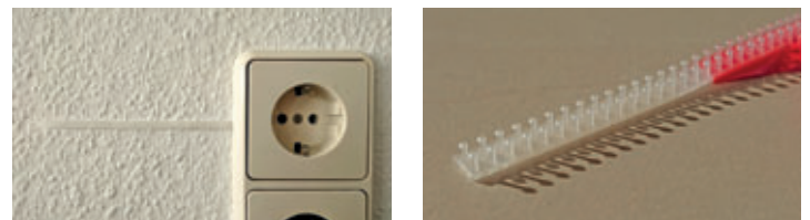
Transparenter Glasfaserkanal zur Verlängerung der Faser