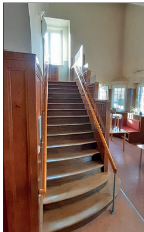
instandgesetzte Holzterrasse mit transparenter Absturzsicherung

So kommt der Stadtanzeiger Hartha zusätzlich in Ihren elektronischen Briefkasten