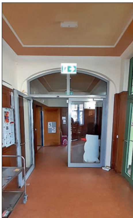
Neu errichtetes Alu - Türelement

Öffentlichkeitsarbeit Stadtverwaltung Hartha