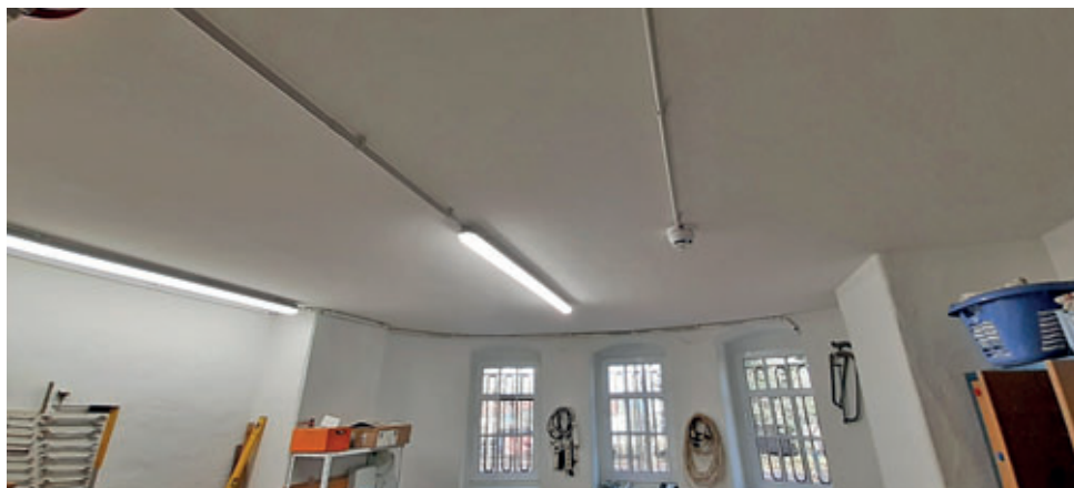
Trockenbaudecke im Hausmeisterraum