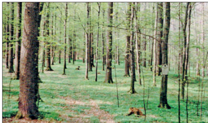
Blick in das Naturschutzgebiet „Staupenbachtal“

Er ist ein Abschnitt der linksseitigen Hangkette des Staupenbachs, steigt nicht all zu steil nach West/ Nordwest/ Südwest aus der Bachaue auf und geht dann in die löblichbedeckte Wendishainer Hochfläche über.