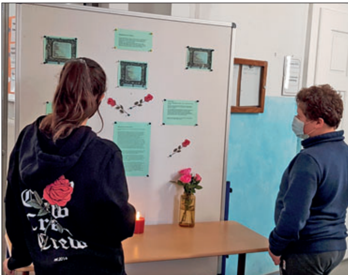
2 Schüler der Klasse 6b, die beim Einrichten halfen.