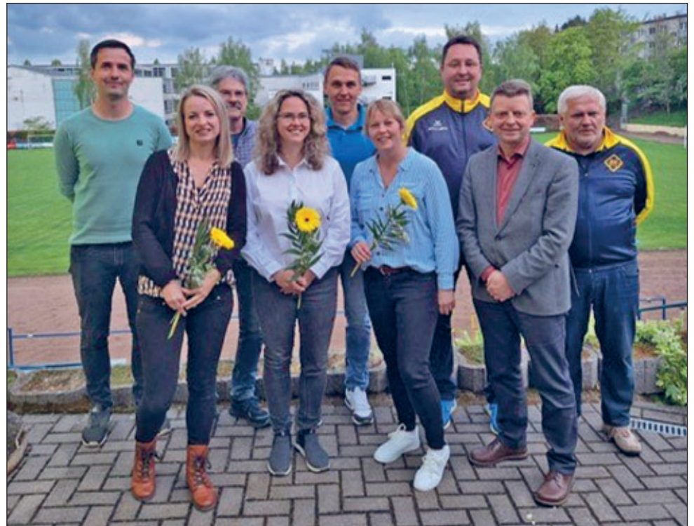
Vorstand BC Hartha 2024