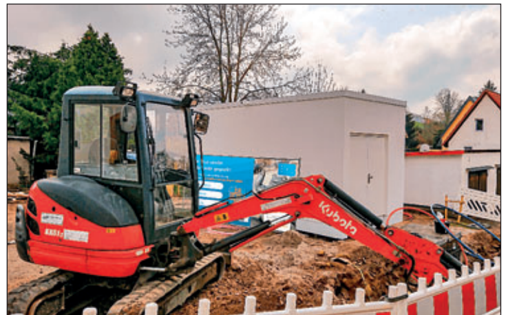
Autor & Bildquelle: Web + Phone GmbH

Mehr Informationen zum geförderten Breitbandausbau finden Sie unter: www.wp-traffic.de/breitbandausbau-hartha