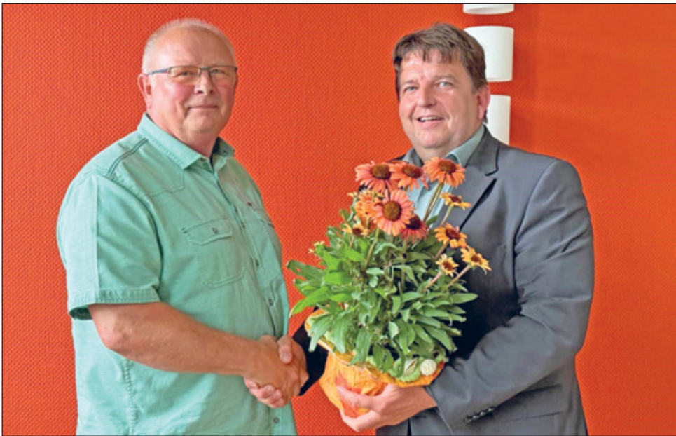
Text und Bild: Stadtverwaltung Hartha

Wie gewohnt finden die Sprechzeiten des Friedensrichters jeden ersten Dienstag im Monat von 16:00 Uhr bis 17:00 Uhr im kleinen Sitzungssaal im Rathaus statt.