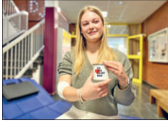
Foto: Junge Erstspenderin, die nach ihrer Blutspende die Information über ihre Blutgruppe erhält; ©DRK-Blutspendedienst Nord-Ost

Auch während der Sommer- und Ferienzeit können nur kontinuierliche Blutspenden die Patientenversorgung absichern