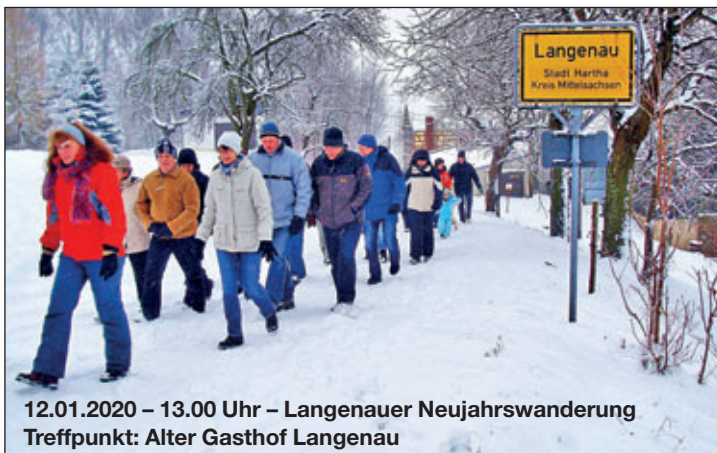
12.01.2020 – 13.00 Uhr – Langenauer Neujahrswanderung Treffpunkt: Alter Gasthof Langenau