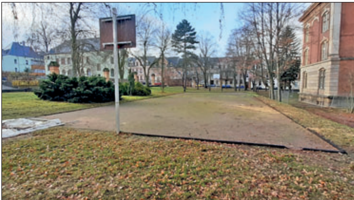
Aufnahme vom heutigen Ballspielfeld südlich der Pestalozzischule

Dankbar nimmt das Bauamt entsprechendes Material im Rathaus, Zimmer 2.03 - 2.05 entgegen. Ihre Unterlagen werden wir ggf. kopieren bzw. einscannen. Diese bleiben dabei unbeschadet. Digitale Dokumente können Sie uns gern per Email an bauamt@hartha.de senden.