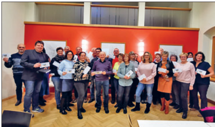
Mitglieder der Arbeitsgruppen beim letzten Treffen 2022

Planung und Koordinierung Programmabläufe, Bühnen-Standorte