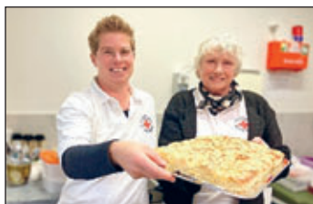
Ehrenamtliche Helferinnen unterstützen bei der Spenderverpflegung

Ehrenamtliche Helferinnen und Helfer, die teilweise seit vielen Jahren regelmäßig die DRK Blutspendetermine in ihrer Region unterstützen, nennen immer wieder die Stärkung der Gemeinschaft, das Knüpfen neuer Kontakte und das schöne Gefühl, etwas Gutes getan zu haben, als Motivation für ihr Engagement. Die Freude, die man anderen Menschen mit seiner Arbeit bereitet, wird damit zur eigenen Freude.