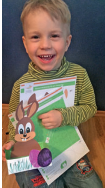
Hugo macht es vor und bastelt ein Osternest für Nestbau in Mittelsachsen.

Nestbau-Zentrale Mittelsachsen Rosa-Luxemburg-Straße 1, 04720 Döbeln Telefon: 03431/7057158 Email: info@nestbau-mittelsachsen.de Internet: www.nestbau-mittelsachsen.de