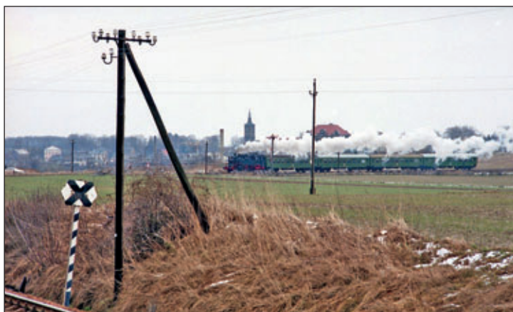
Die Kirche von Hartha mit einem Dampflok-Zug – diese Ansicht wird es nie wieder geben.

Die Fotos stammen zum großen Teil aus dem Fundus des Harthaer Hobbyfotografen Uwe Gebhardt. Er hat eine Vielzahl von Aufnahmen Anfang der 90ziger Jahre bis zur Einstellung des Eisenbahnverkehrs auf der W-R Linie (Waldheim-Rochlitz) gemacht. Die alte Bahntrasse war 20 Jahre verwaist, doch nun soll daraus der Radweg Zschopau-Zwickauer Mulde entstehen. Der erste Abschnitt von Waldheim bis Richzenhain existiert bereits und wird von Radfahrern wie auch Wanderern rege genutzt. Der zweite Teil nach Hartha ist im Bau und soll bis April fertiggestellt werden. Man kann nur hoffen, dass es dann bald zügig weiter nach Rochlitz geht. Der Radweg wird der ganzen Region eine massive touristische Aufwertung bringen, denn Radfahren liegt im Trend. Angezogen werden nicht nur die Anwohner, sondern auch Touristen aus ganz Deutschland und dem Ausland, die Sachsen per Rad erkunden möchten. In der Fotoausstellung sind sehr interessante Fotos dieser Landschaft in Verbindung mit der Eisenbahn mit Dampf- oder Dieselmotoren, zu sehen. Die Fotos wurden schon im Waldheimer Rathaus gezeigt. Wenn alles klappt, wird zur Eröffnung auch ein Überraschungsgast erwartet. (ht)