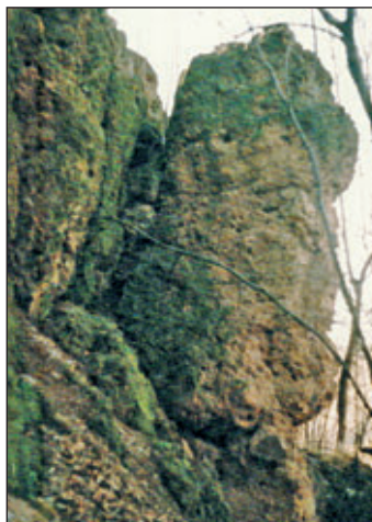
Wolfsberg – mächtige Gesteinsblöcke im ehemaligen Steinbruch am „Wolfsberg in „Becks Wiesen“