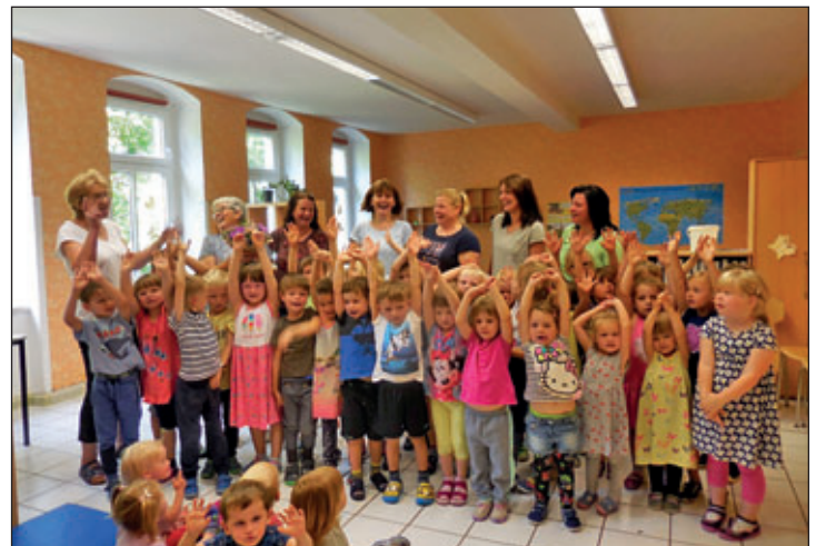
Das Team der Kita „Krümelburg“