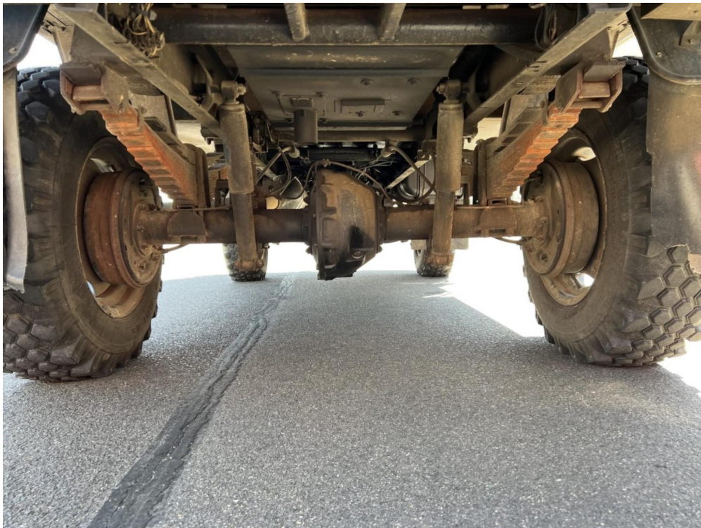
Bild 16 - Unterboden