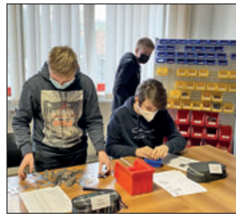
Bildungswerk der Sächsischen Wirtschaft gGmbH Bildungszentrum Döbeln Oststraße 4, 04720 Döbeln