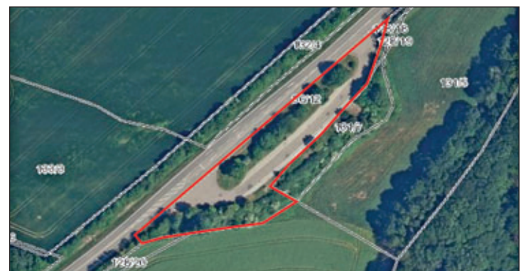
Detailkarte 1:2.000: einzuziehender Teil des Straßenflurstückes 56/12, Gemarkung Nauhain