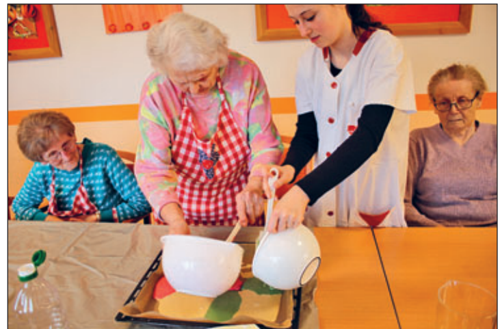
Wer liebt es nicht, selbst gebackener Kuchen. Gemeinsam wurde für das Kaffeetrinken am Nachmittag ein Kuchen gebacken. Das Schönste daran, wie man es aus Kindertagen kennt, war das Ausputzen der Teigschüsseln. Hm, lecker!