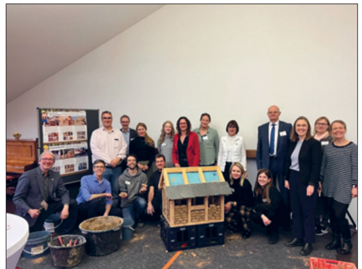
Beim Austauschtreffen der europäischen Modellregionen wurde gemeinsam ein Lehmhaus gebaut, angeleitet vom Naturbau-Campus aus Oschatz. (Urheber: Maikirschen e.K.)

Interessierte können zum Projekt aktiv beitragen: Ob als Best-Practice-Unternehmen, Forschungspartner oder engagierte Akteure – Erfahrungen und Ideen sind gefragt. Mehr Informationen gibt es unter: www.nestbau-mittelsachsen.de/kreislaufwirtschaft .