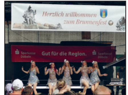
Perlen des Orients